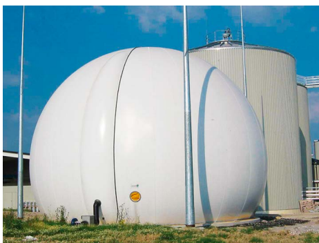
Gasspeicher und Fermenter

Während des Bearbeitungsprozesses werden an verschiedenen Stellen die mineralischen Bestandteile herausgezogen. Der Gärrest aus dem biologischen Zersetzungsprozess bildet als entwässertes Substrat zusammen mit den mineralischen Stoffen das Deponat, welches abgelagert wird.